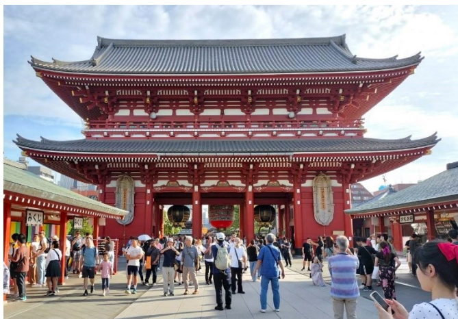
・浅草寺・仲見世通り ・雷門から宝蔵門までの表参道の両側に 立ち並ぶ商店通り