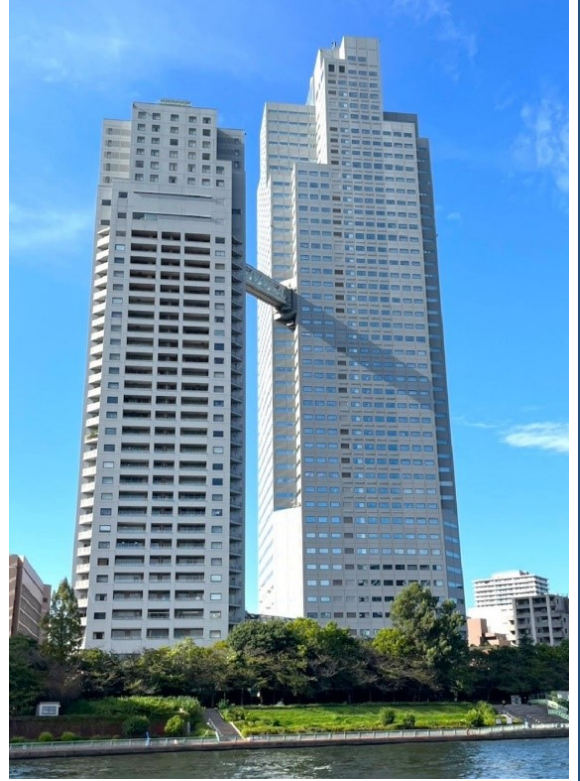
●聖路加ガーデンタワー 下は風抜けの為の建築物か？配慮（南さん）