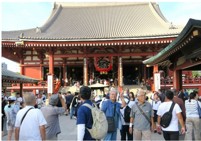
・浅草寺「1400年近い歴史を持つ都内最古のお寺」